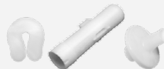
Blueflow Safety Set

AMEDTEC Medizintechnik Aue GmbH Schneeberger Straße 5 · 08280 Aue Tel.: +49 (0)3771 59 82 70 Fax: +49 (0)3771 59 82 790 info@amedtec.de · www.amedtec.de